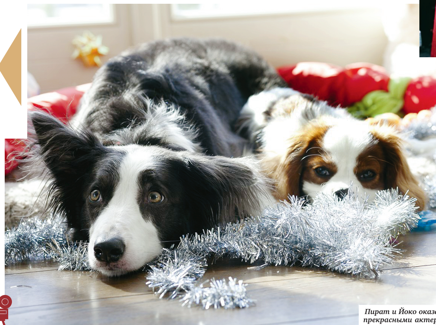
Пират и Йоко оказались прекрасными актерами.

Мы решили вспомнить о самых известных и любимых советских и российских фильмах, в которых снимались собаки.