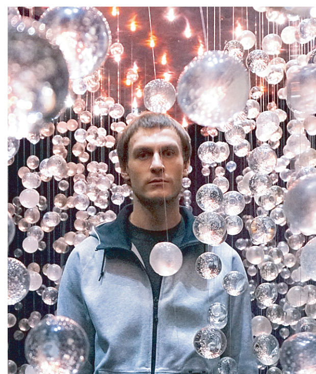
«Вишневый сад» — в хрустальных отражениях за пятнадцать минут можно разглядеть многое.