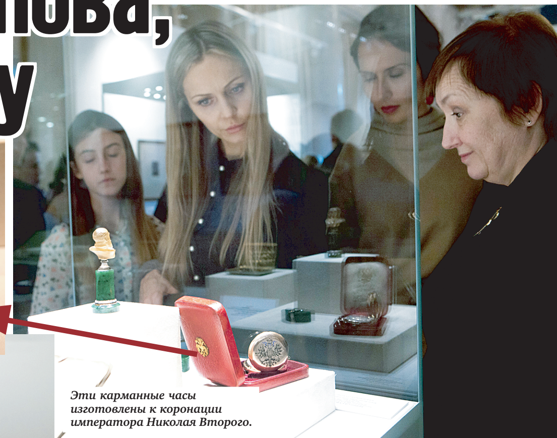
Эти карманные часы изготовлены к коронации императора Николая Второго.

специальному заказу к коронации императора Николая Второго.