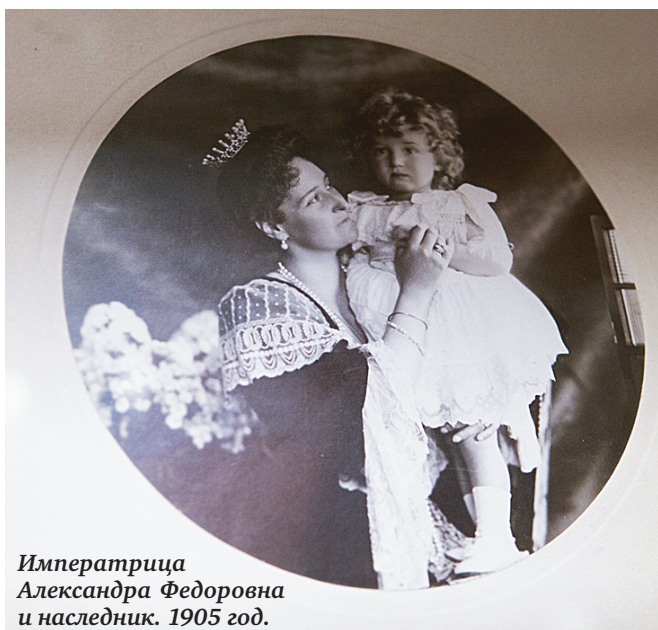
Императрица Александра Федоровна и наследник. 1905 год.

— Да, несмотря на кризис! Я думаю, что такие события как раз очень хорошо воздействуют на всех нас, благотворны для общей бодрости духа. Есть вещи, которые не купить нельзя.