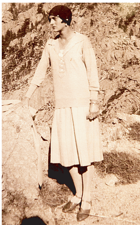
...и Ирина Юсуповы. Корсика. 1924 — 1925 годы.

В МУЗЕЕ ФАБЕРЖЕ НА ФОНТАНКЕ УНИКАЛЬНЫЙ ЛИЧНЫЙ АРХИВ КНЯЗЕЙ ФЕЛИКСА И ИРИНЫ ЮСУПОВЫХ ПЕРЕДАЛИ В ДАР ГОСУДАРСТВЕННОМУ АРХИВУ РОССИЙСКОЙ ФЕДЕРАЦИИ