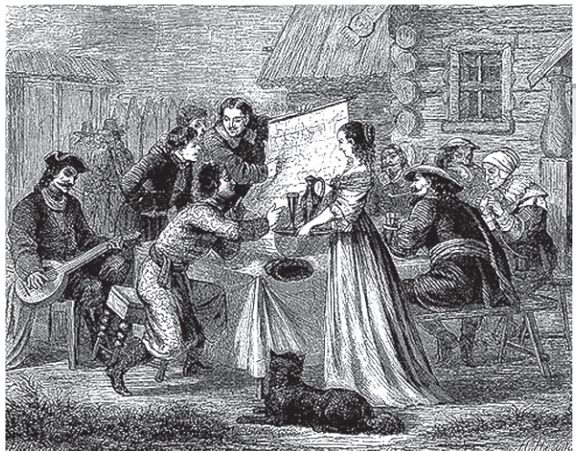
«Вина, вина — хоть яд оно!» Царь Петр вновь заехал к кому-то в Немецкую слободу. 1690-е годы. Старинная гравюра.