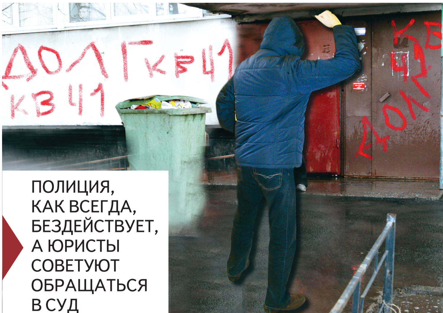
Коллаж Сергея БОНДАРЬЕВСКОГО

Выбивая задолженность перед кредитором, коллекторы разгромили парадное, испортив общее имущество собственников многоквартирного дома на Октябрьской набережной, 26/3, а должнику пообещали забросать его квартиру шумовыми гранатами. Юристы советуют обращаться в полицию, поскольку должник столкнулся с вымогателями и хулиганами.