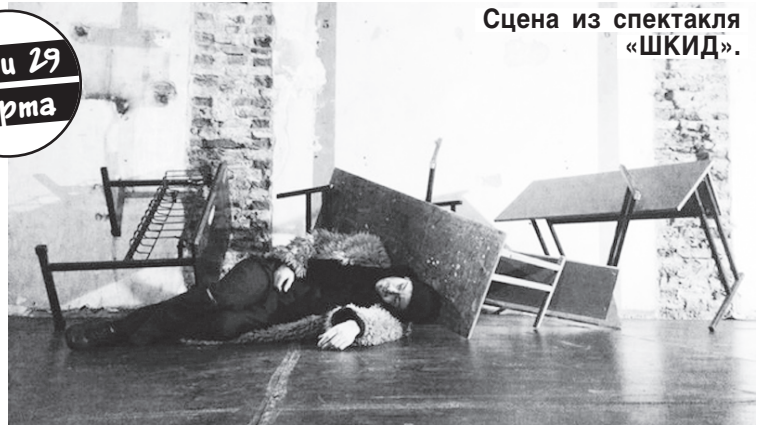
Сцена из спектакля «ШКИД».

Неожиданно актуальной увидели знаменитую повесть двадцатых годов прошлого века «Республика ШКИД» участники одной из самых ярких молодых театральных команд Петербурга — «Этюд-театра». 10 и 29 марта на площадке «Скорород» (Московский пр., 107/5) будет впервые сыгран спектакль «ШКИД» в постановке режиссера Семена Серзина.