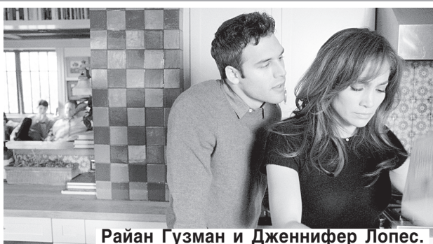
Райан Гузман и Дженнифер Лопес.