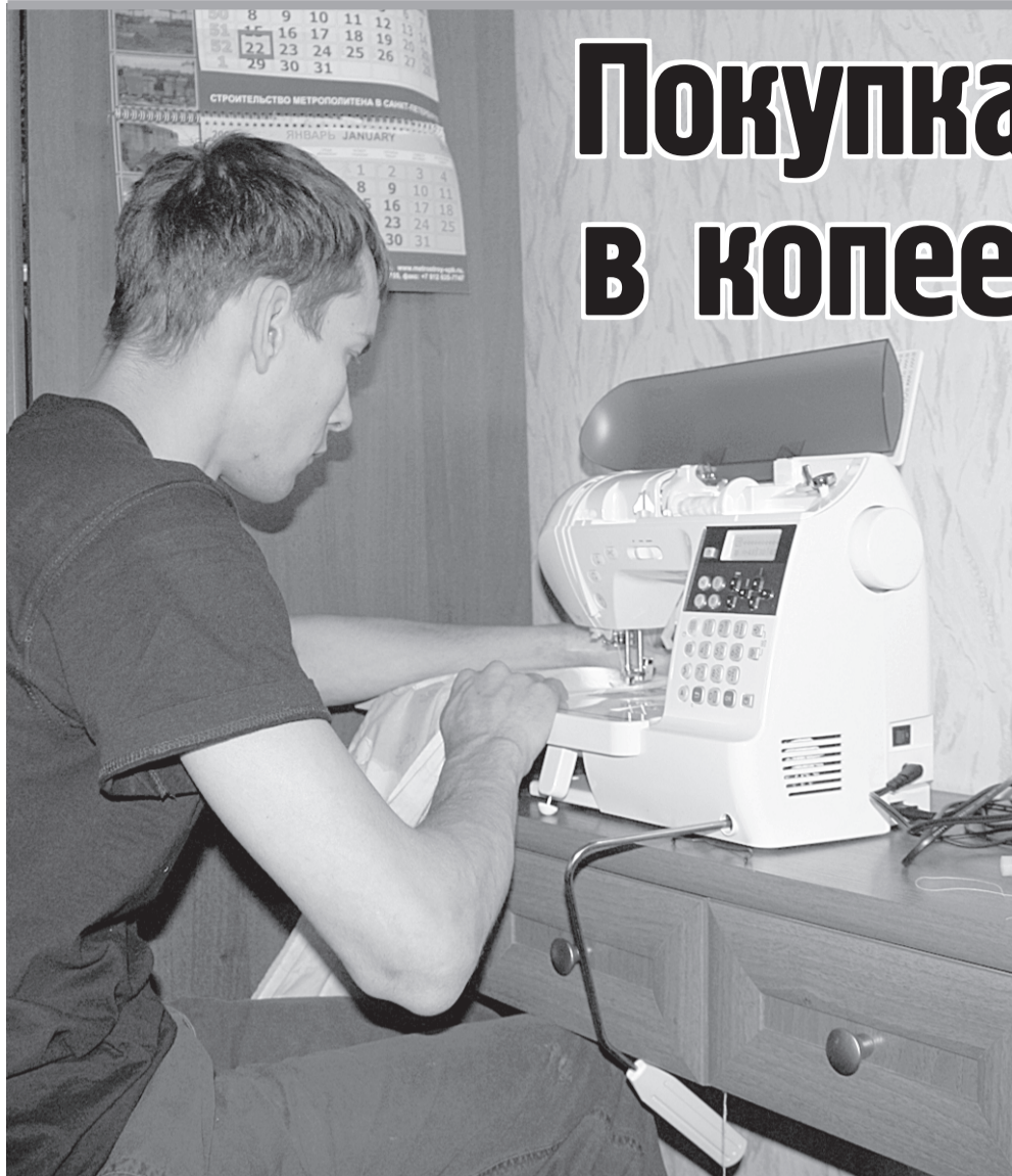
Шитье — занятие творческое.