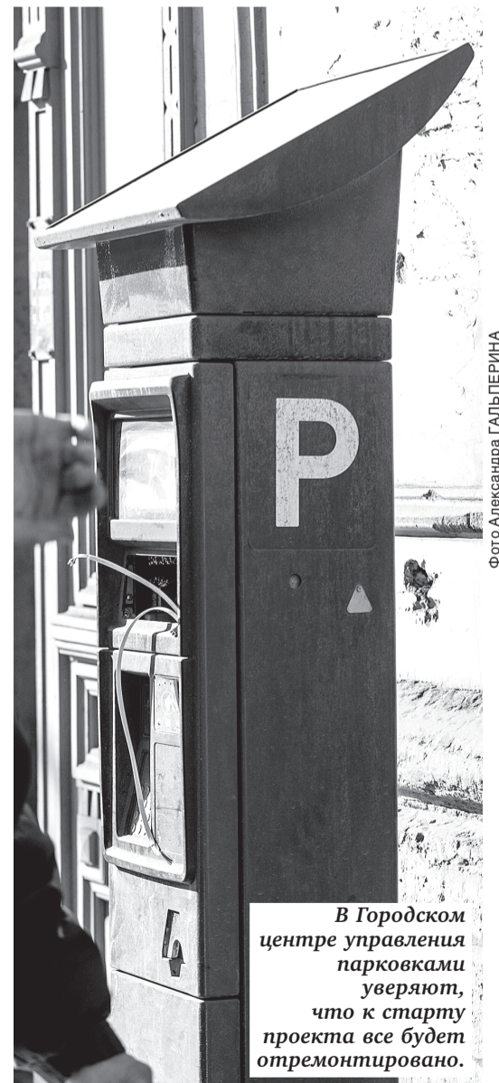
В Городском центре управления парковками уверяют, что к старту проекта все будет отремонтировано.