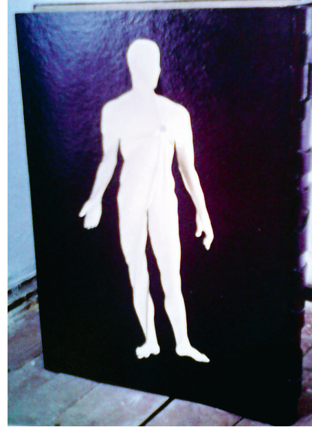
«Черная книга» — прижизненное надгробие художника — за 27 лет ничуть не потеряла актуальности.