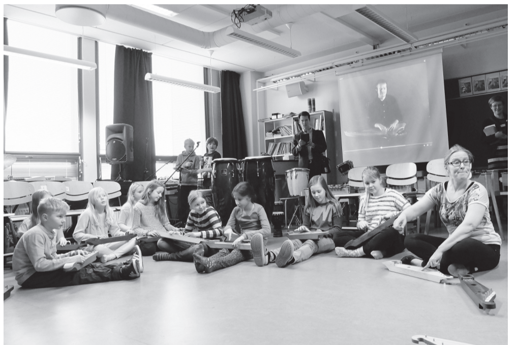
Урок игры на кантеле в школе педагогической практики в Виikki.

объясняют, почему родители каждый день ходят на работу, откуда берутся деньги, что такое налоги, и прочие азы жизни. Они должны выбрать профессию, которой будут заняты в городе. Музей техники выделил помещение, в котором расположились мэрия, полиция, больница, редакция местной газеты, банк, кафе, парикмахерская и прочие заведения. Школьники приходят в город и в первую очередь получают кредит от банка. На эти деньги город будет жить день, в конце дня деньги вернутся в банк. Деньги настоящие, проект поддерживают предприятия и местные банки, кото-