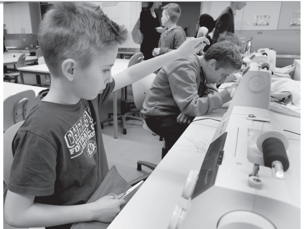
Шитье — занятие серьезное.

В центре школьники проводят день, ему предшествуют 10 уроков в школе. Детям