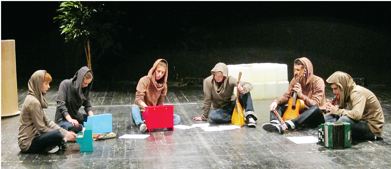
Можно исполнить вполне серьезную музыку на игрушечных пианино, гитаре и балалайке.

Сцена Малого зала превращена в подобие подвала. Женский голос с металлическими интонациями объявляет, что собравшимся надо пройти в убежище. Картонные коробки, напряженный свет низкого потолка, вигвам из деревянных длинных брусков — вот антураж убежища, в котором оказываются шесть молодых людей — трое парней и три девушки.