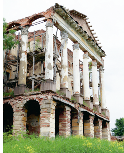
Ропшу надо спасти всем миром.