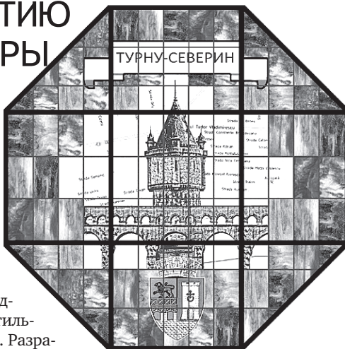
Витражи центральной стены зала.

Людмила КЛУШИНА, эскизы: «Ленметрогипротранс»