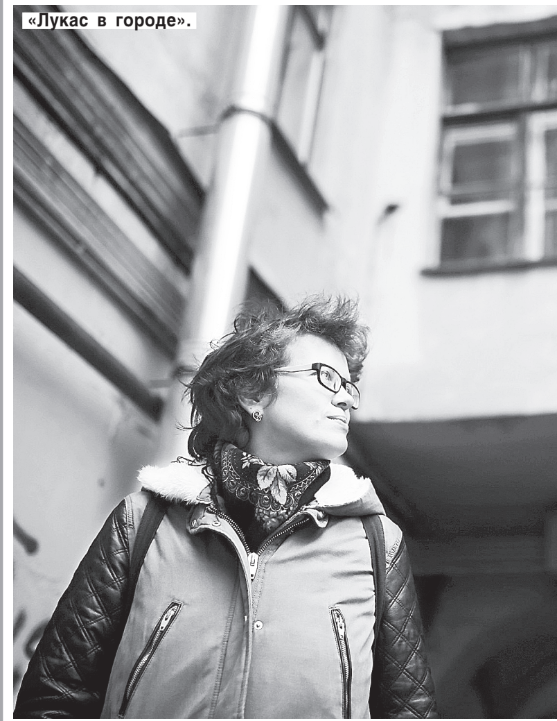
«Лукас в городе».