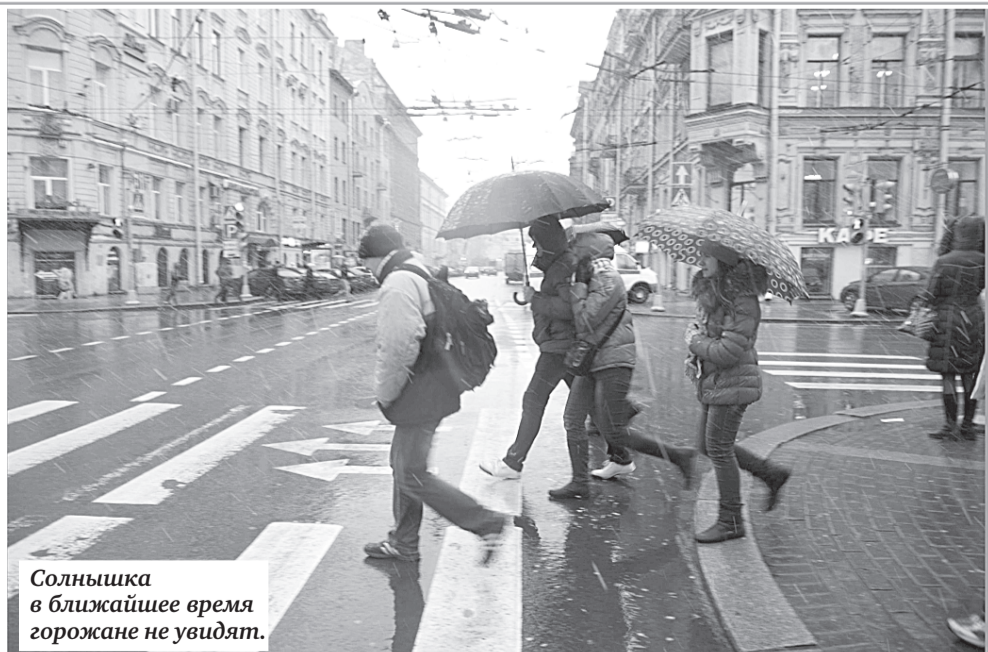
Солнышка в ближайшее время горожане не увидят.