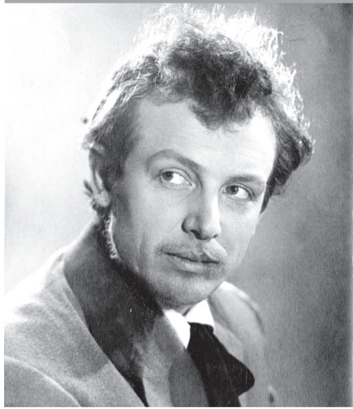
Князь Мышкин — Иннокентий Смоктуновский. Первая редакция спектакля «Идиот», 1957 год.

БДТ ОТМЕТИЛ 90-летие АКТЕРА НА ПОДМОСТКАХ, ГДЕ ВОЗНИК КНЯЗЬ МЫШКИН