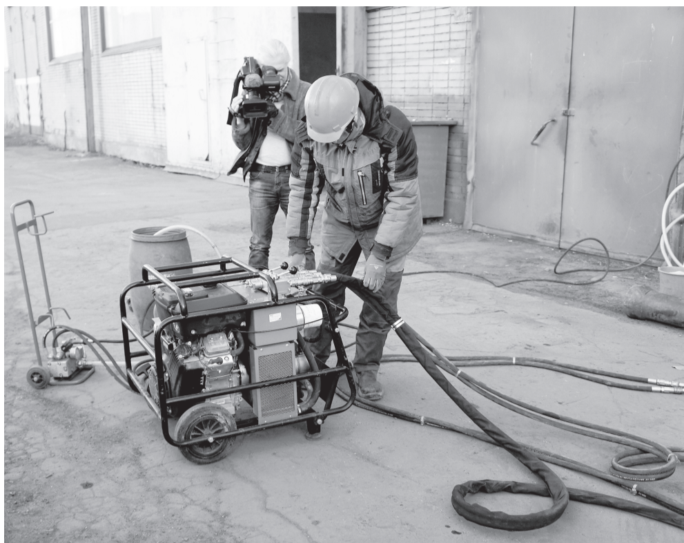
Одно нажатие кнопки — и оборудование готово к работе.

Петербургские инженеры разработали новый практически бесшумный и компактный эскалатор для петербургского метро. Символично, что новинка появилась в стенах Кировского завода — одного из ведущих предприятий военно-промышленного комплекса страны. Первым из чиновников Смольного прокатился на новом эскалаторе вице-губернатор Игорь Албин.