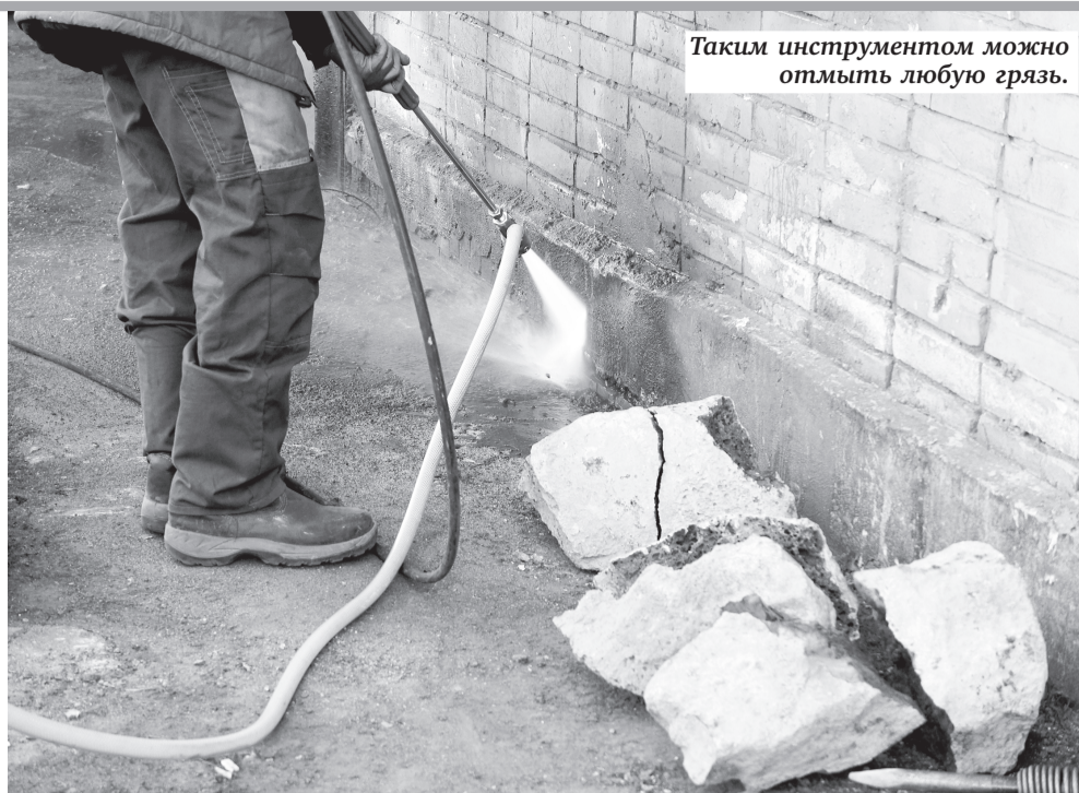
Таким инструментом можно отмыть любую грязь.

НА ВОЕННОМ ПРЕДПРИЯТИИ ОСВОИЛИ ВЫПУСК ЭСКАЛАТОРОВ, ЛИФТОВ И ИНСТРУМЕНТОВ ДЛЯ ЖКХ