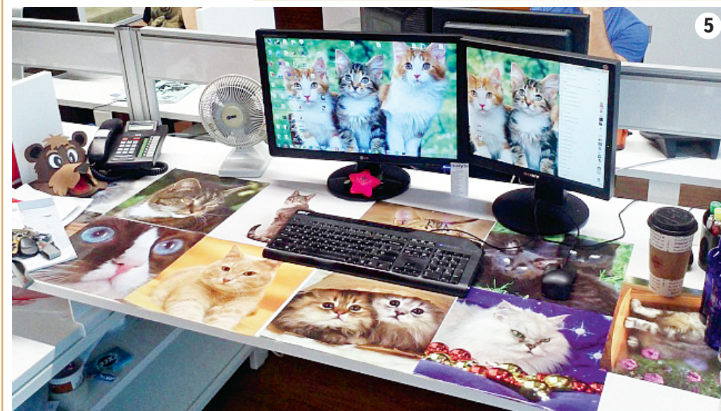
Павел КИСЕЛЕВ