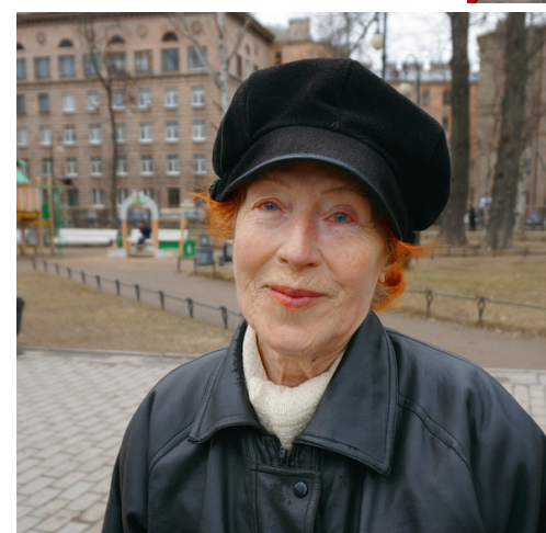
Подготовил Сергей ПРУДНИКОВ