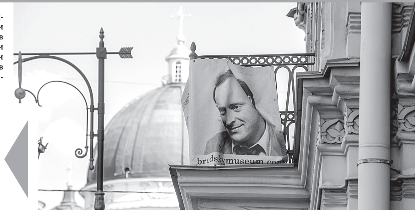
В доме Мурузи создается музей Иосифа Бродского.