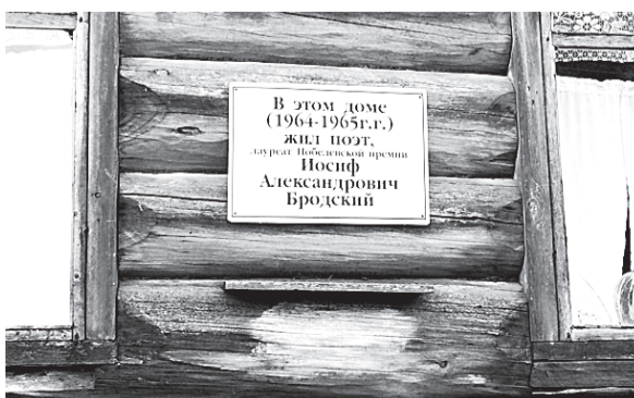
Мемориальная доска на доме Бродского в Норинской.