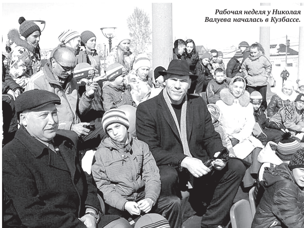
Рабочая неделя у Николая Валуева началась в Кузбассе.