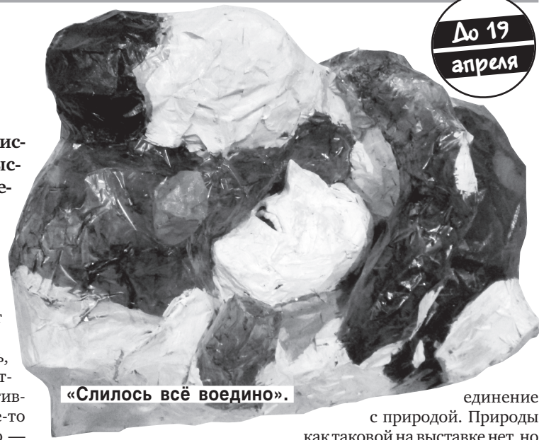
«Слилось всё воедино».

ется, стремится не столько что-то изобразить, сколько передать свои ощущения: «Цветовая гамма почти всех объектов у меня ассоциируется с радостью, а вот красный связан с чувством вины, страданием, отчаянием. Но основной идеей была попытка показать счастье, гармонию. Это попытка придать чувствам форму,