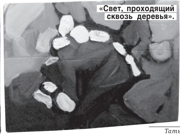
«Свет, проходящий сквозь деревья».