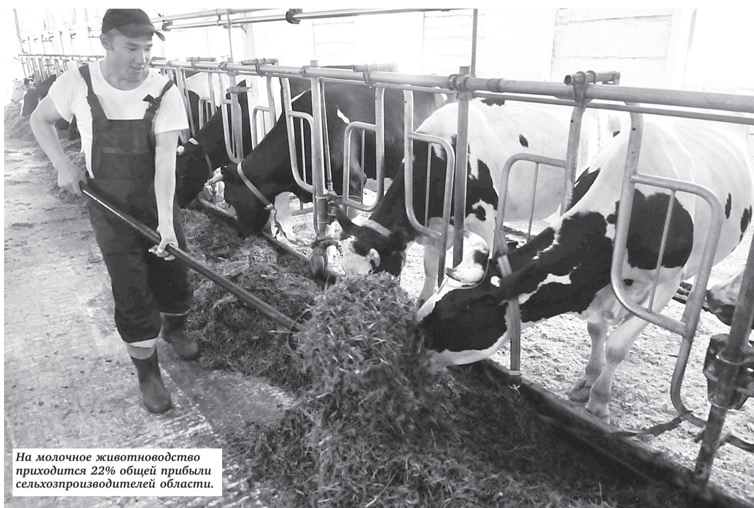
На молочное животноводство приходится 22% общей прибыли сельхозпроизводителей области.

В общем, с ходу разобраться в тонкостях механизма отечественного ценообразования не получится. Ясно одно: в магазинах сельхозпродукция неумолимо дорожает. Свежие огурцы стоят уже под 200 рублей за килограмм.