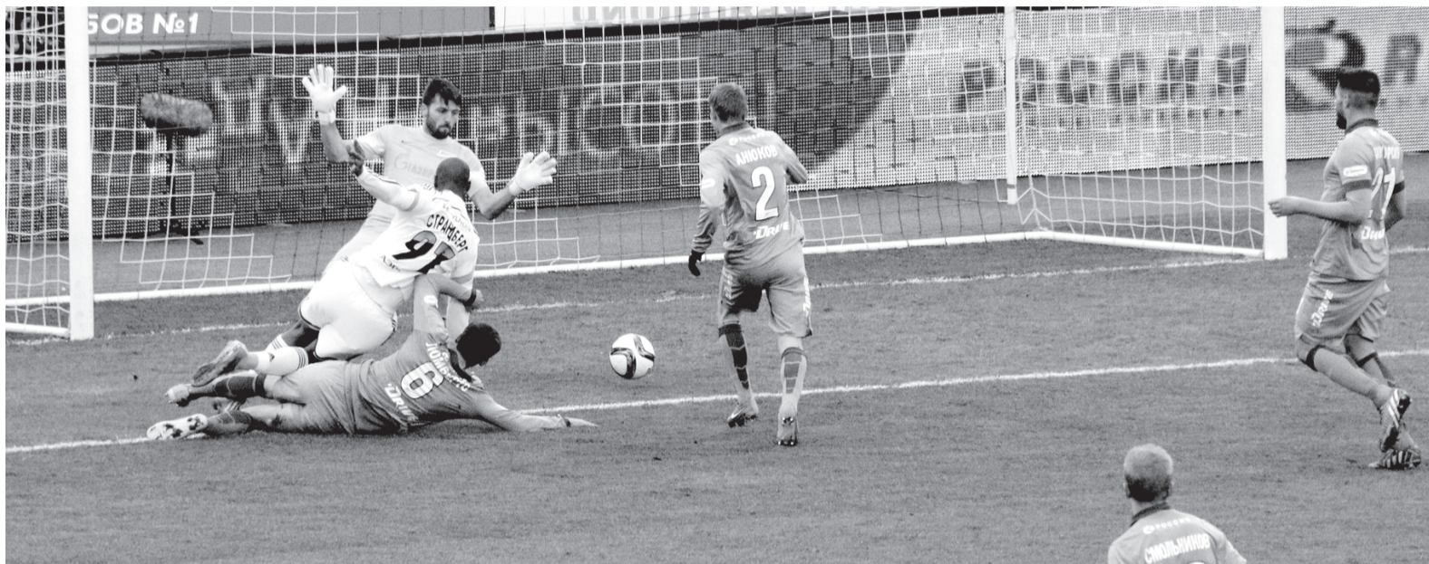
Ответный гол ЦСКА на 80-й минуте матча, возродивший интригу.

КОМАНДА АНДРЕ ВИЛЛАШ-БОАША ОДЕРЖАЛА НА «ПЕТРОВСКОМ» ПРИНЦИПИАЛЬНУЮ ПОБЕДУ НАД ПРЯМЫМ КОНКУРЕНТОМ ЗА ТИТУЛ