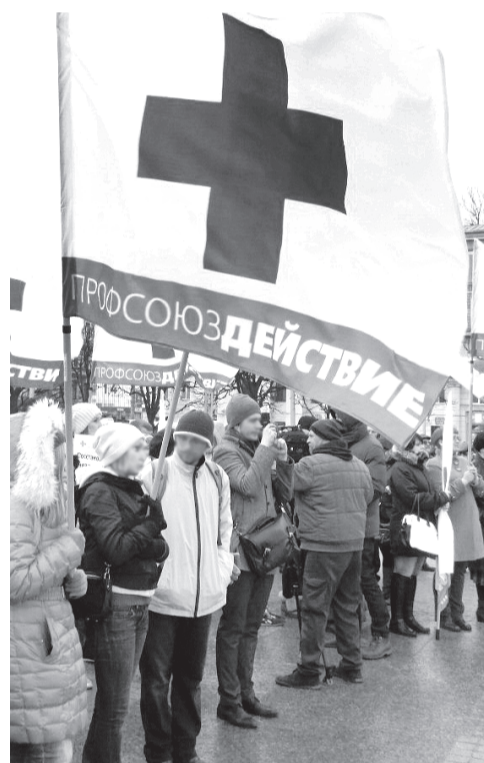
Чтобы получить более-менее приличную зарплату, медики вынуждены работать на 2—3 ставки.

Одновременно митингующие подняли смежный вопрос — о безопасности медпер-