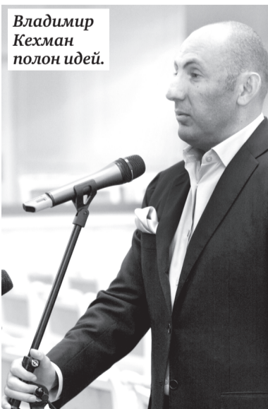
Владимир Кехман полон идей.

Напомним, после назначения Владимира Кехмана в Новосибирск министр культуры России Владимир Мединский объявил о том, что с поста директора Михайловского театра Кехману придется уйти. Кто займет его место здесь, в Петербурге, — пока вопрос.