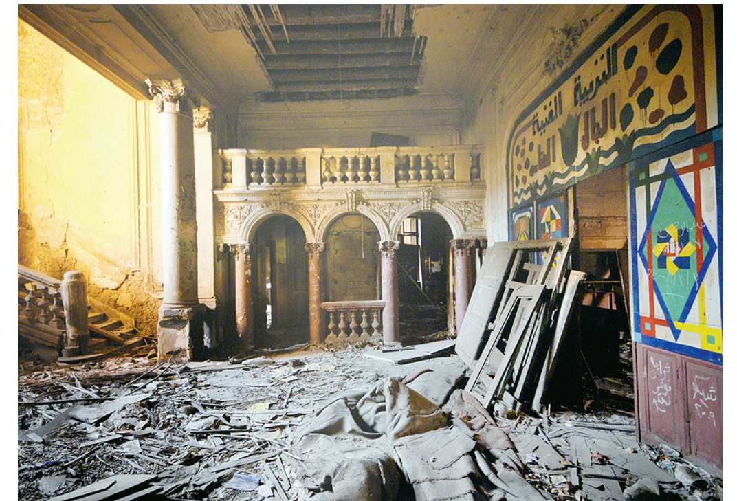
«История искусства». Дворец Багуз. Каир. 2011.