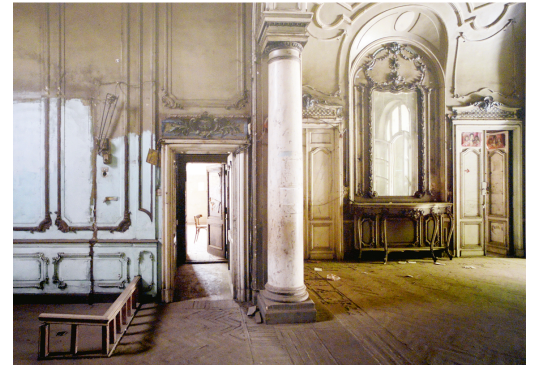
Вилла Каздагли в Гарден Сити. Каир. 2010.