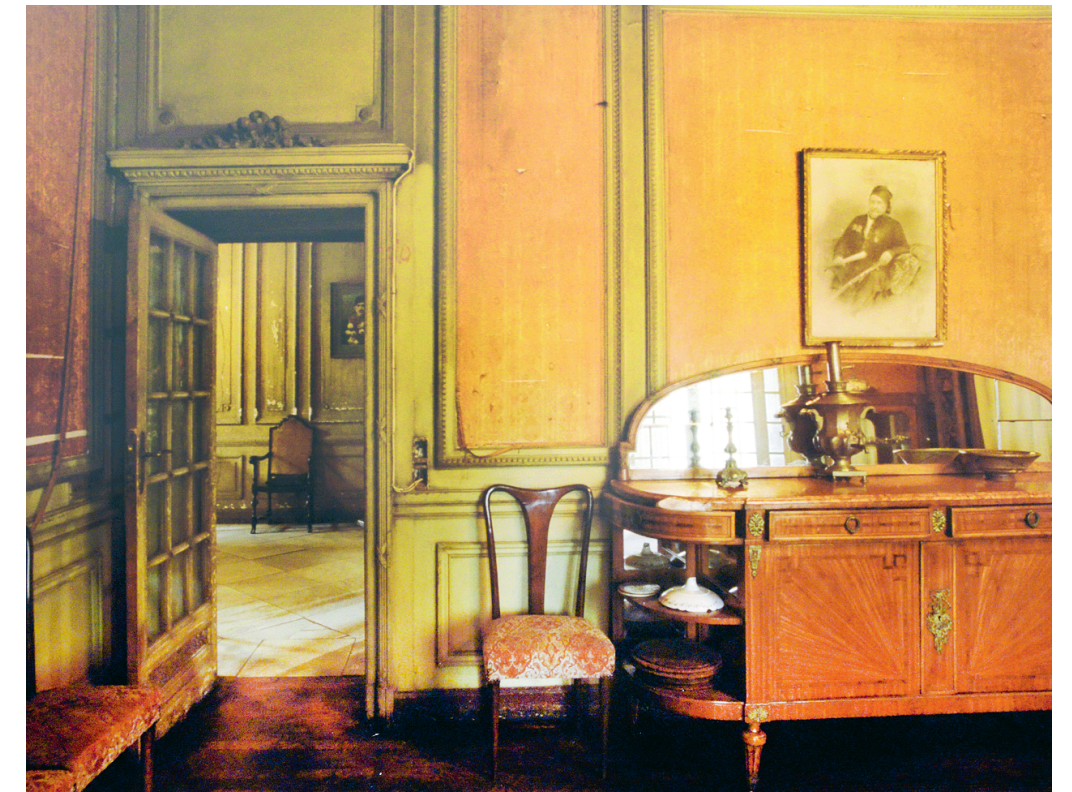
Дом Махмуда Сабита. На стене — старинный фотопортрет одного из предков хозяина дома. Каир. 2008.