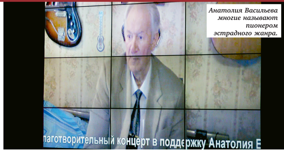
Анатолия Васильева многие называют пионером эстрадного жанра.

В КОНЦЕРТНОМ ЗАЛЕ «КОЛИЗЕЙ» ПРОШЕЛ БЛАГОТВОРИТЕЛЬНЫЙ КОНЦЕРТ В ПОДДЕРЖКУ ОСНОВАТЕЛЯ ВИА «ПОЮЩИЕ ГИТАРЫ»