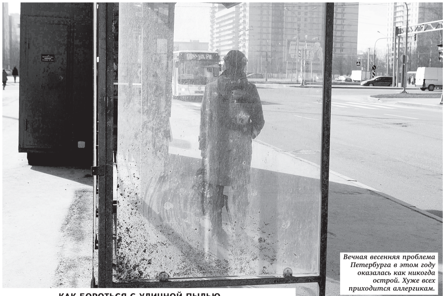
Вечная весенняя проблема Петербурга в этом году оказалась как никогда острой. Хуже всех приходится аллергикам.