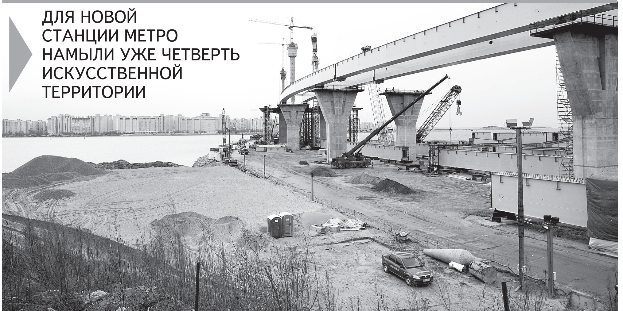
Главная текущая задача — намыв песка — решается с опережением почти на месяц.