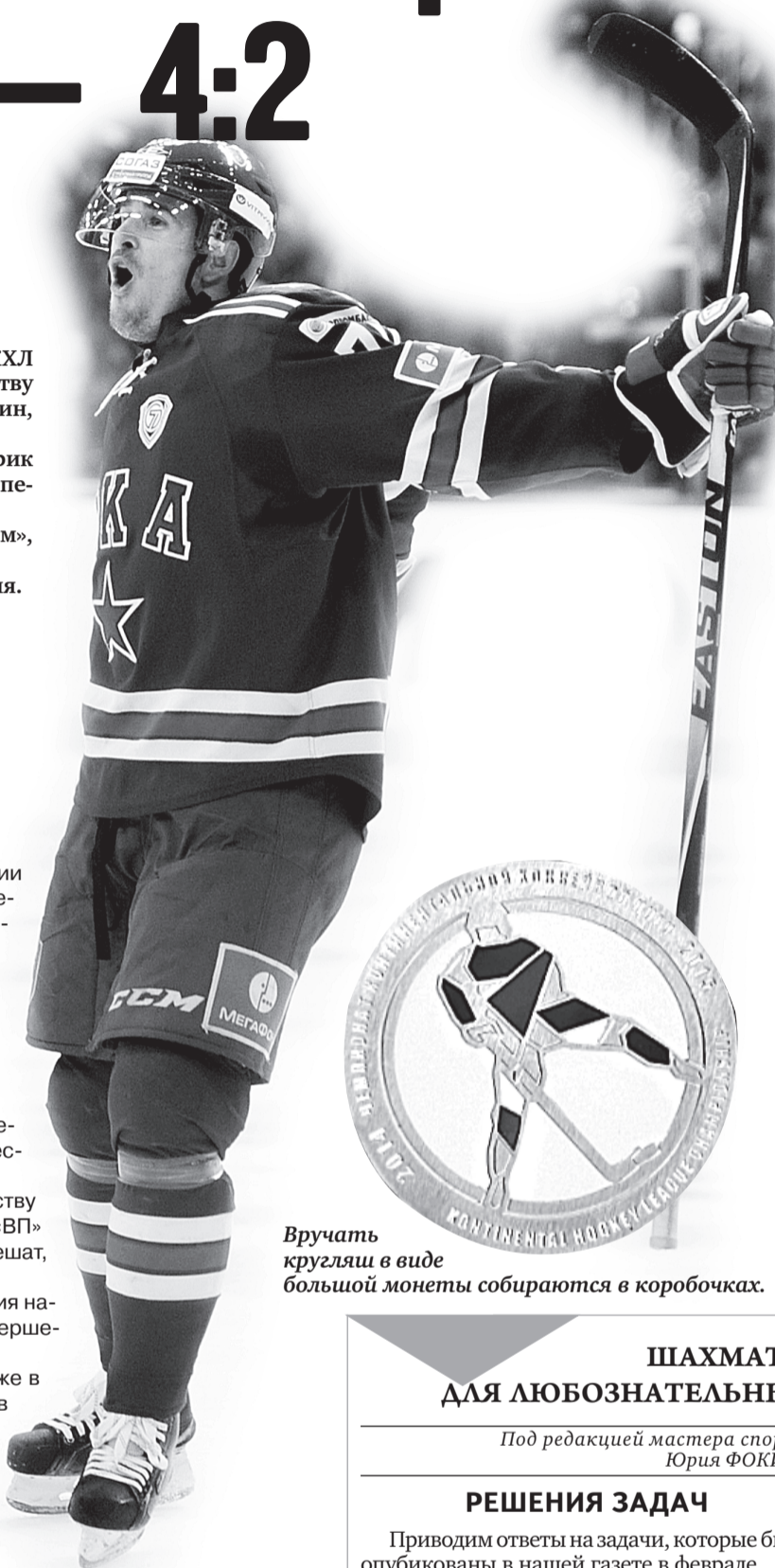
Вручать кругляш в виде большой монеты собираются в коробочках.