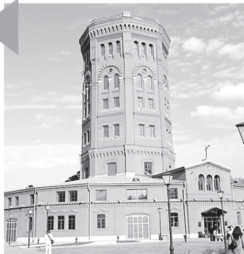
МУЗЕЙ ГОРОДСКОГО ЭЛЕКТРИЧЕСКОГО ТРАНСПОРТА

Все начнется 16 апреля в 11 утра . По словам сотрудников музея, инсталляция включает в себя пропускной пункт и маскировку — поскольку у «Ленводоканала» были охраняемые и замаскированные объекты. Обещают ролевою игру с элементами экскурсии: можно будет увидеть ремонтную яму, узнать, как размораживали трубы во время тридцатиградусных морозов, в штабной палатке получить указания и самостоятельно предотвратить аварию. И даже попробовать себя в роли огородников — в соответствии с рекомендациями настенных боевых листов и газеты «Огородник», которая выпускалась даже в 1941 — 1942 годах. Предложат посадить огород по военным правилам.