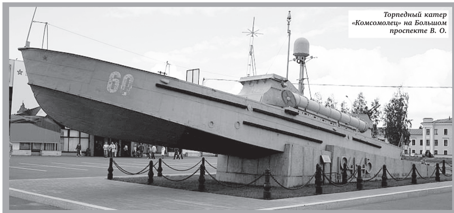
Торпедный катер «Комсомолец» на Большом проспекте В. О.