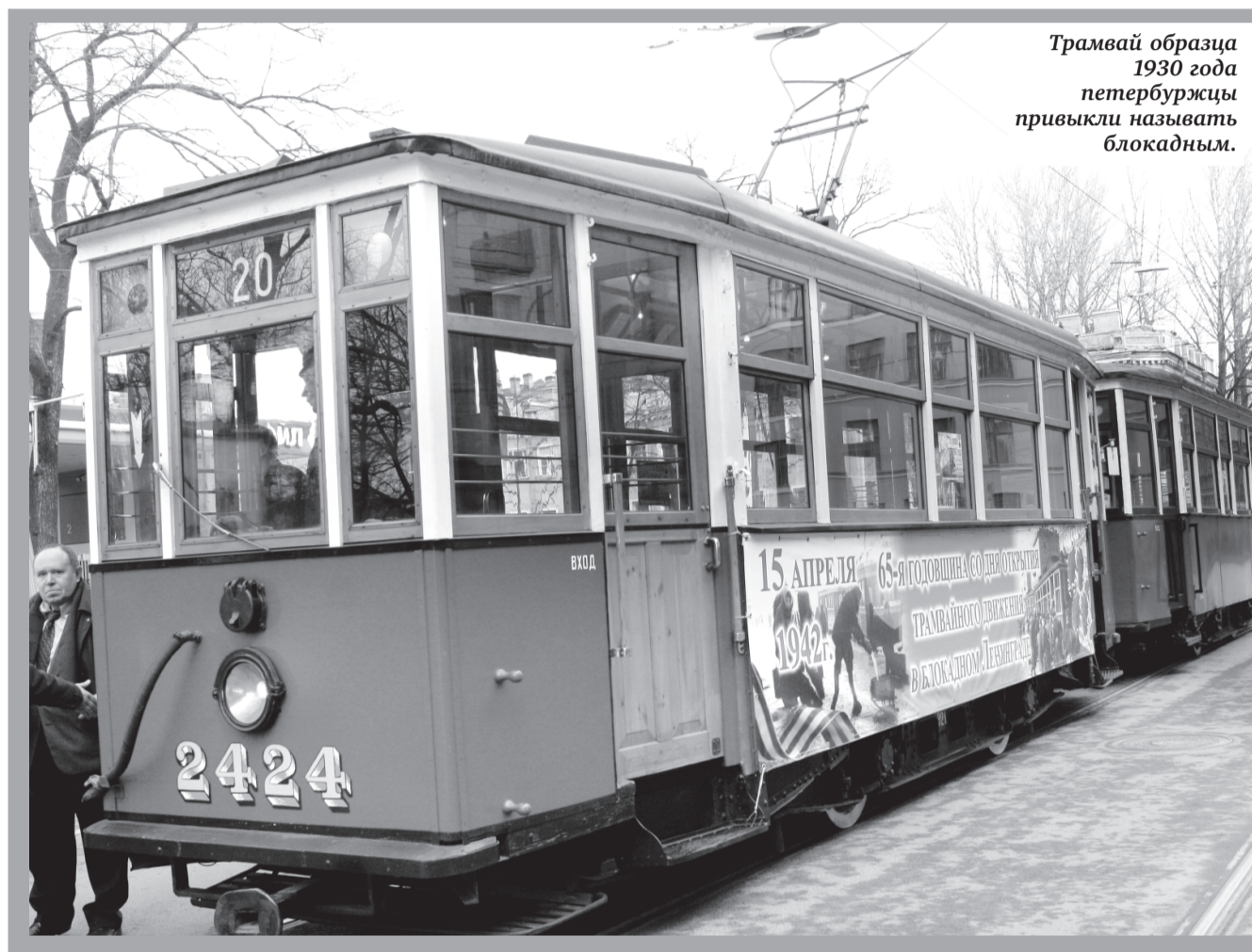
Трамвай образца 1930 года петербуржцы привыкли называть блокадным.