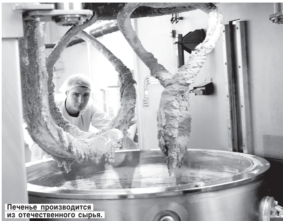
Печенье производится из отечественного сырья.

Любите ли вы овсяное печенье? Подавляющее большинство ответят на этот вопрос утвердительно. Лакомство появилось на полках наших магазинов не так давно, но первоначально доставляли его к нам исключительно зарубежные производители. И вот пятнадцать лет назад в Ленинградской области была построена фабрика, 80% продукции которой составляло любимое народом овсяное печенье. За прошедшее время фабрика преобразовалась в кондитерское объединение и заняла на отечественном рынке подобающее место.