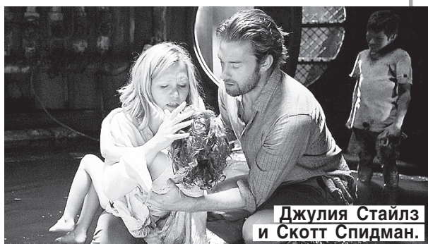
Джулия Стайлз и Скотт Спидман.