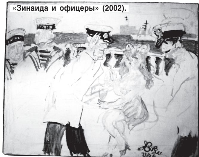
«Зинаида и офицеры» (2002).

Сейчас, конечно, митьков как движения давно нет, художники разбрелись, у каждого «сольная карьера», но каждый из них остается в том живописном мире, который сам для себя придумал.