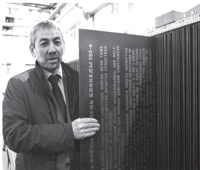
Для 25-килограммовых бронзовых страниц в подземном зале монумента создали специальное хранилище. Теперь листы можно комфортно вынимать и хранить, не повреждая.