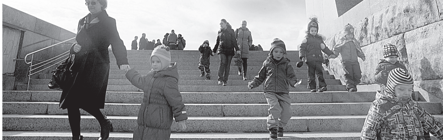
Ансамбль «Победители»: скульптуры очистили, удалили с них пятна ржавчины, заполнили швы и трещины, провели патинирование.

Также отреставрированы светильники с Вечным огнем, заменены газовые горелки, проведена новая труба газопровода. Выполнен ремонт бетонного основания «Разорванного кольца» и бронзового панно с барельефами. Вновь позолочены буквы памятных текстов.