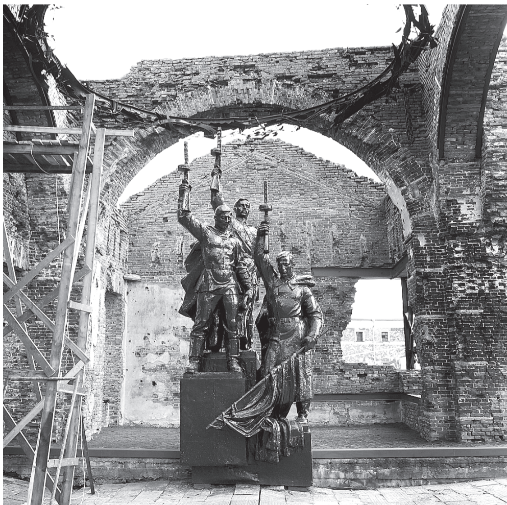
Монумент «Клятва» изображает солдата, матроса и командира, которые клянутся не уходить с острова и защищать Орешек. Скульптуры отреставрированы впервые за 30 лет.

Помимо этого покрашены и отремонтированы артиллерийские орудия: две 76-миллиметровки и две 45-миллиметровки — образцы пушек, которые находились на вооружении защитников крепости. А также восстановлен флашток над остовом Иоанновского собора, на котором впервые со времен обороны поднят красный флаг.