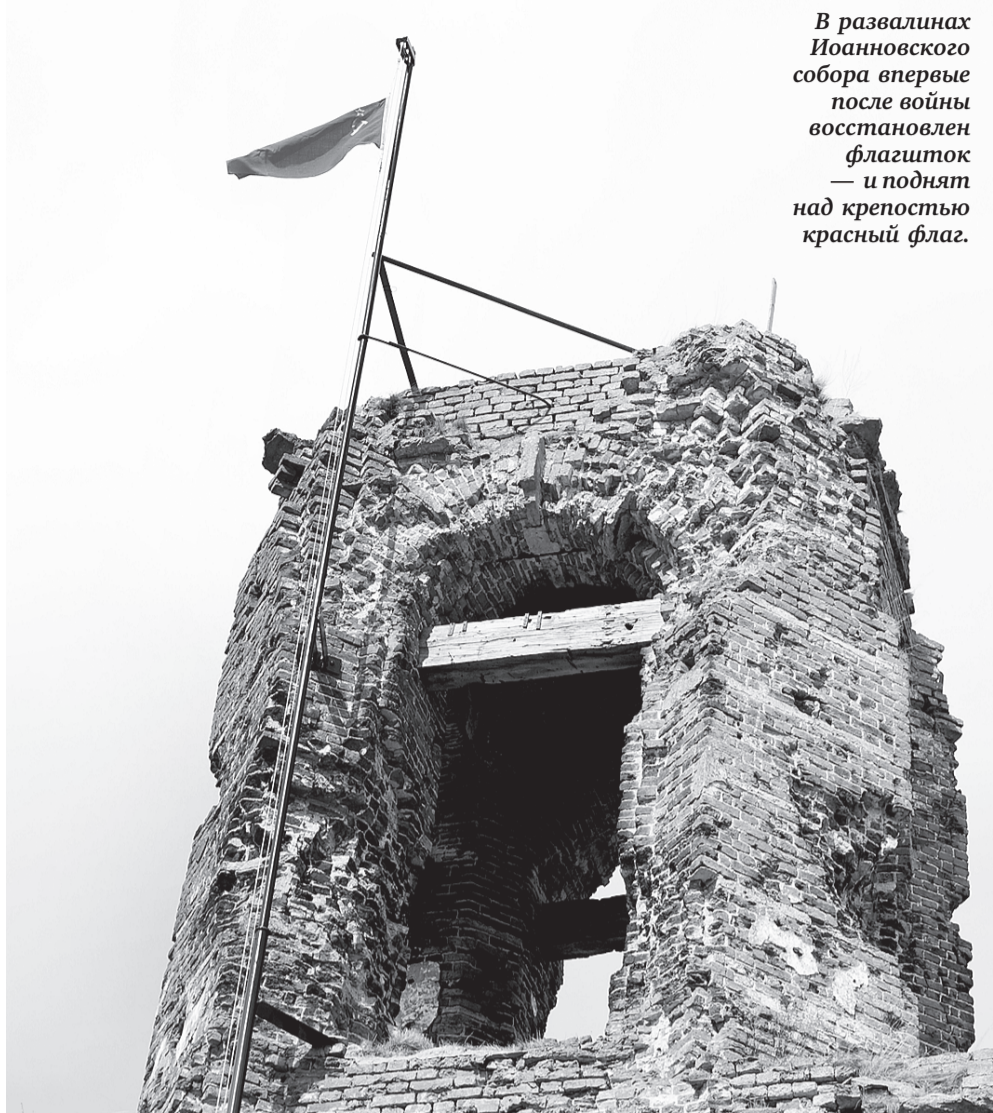
В развалинах Иоанновского собора впервые после войны восстановлен флашток — и поднят над крепостью красный флаг.