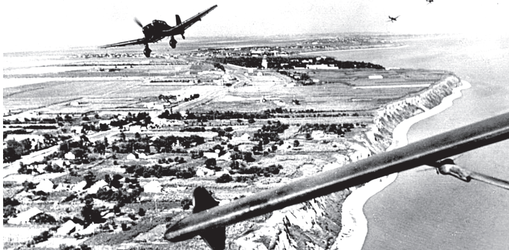
Согласно рассекреченным данным, воздушные бои в районе Ленинграда прошли уже 22 июня, в первый день войны.

Подготовил Сергей ПРУДНИКОВ