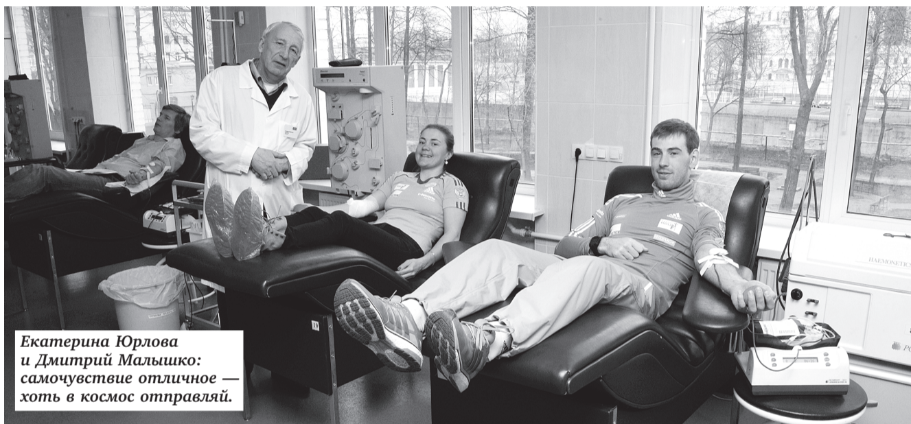
Екатерина Юрлова и Дмитрий Малышко: самочувствие отличное — хоть в космос отправляй.