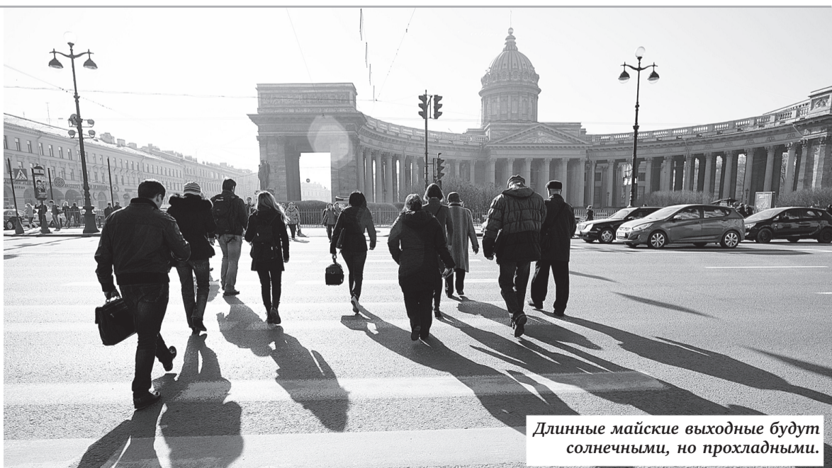
Длинные майские выходные будут солнечными, но прохладными.