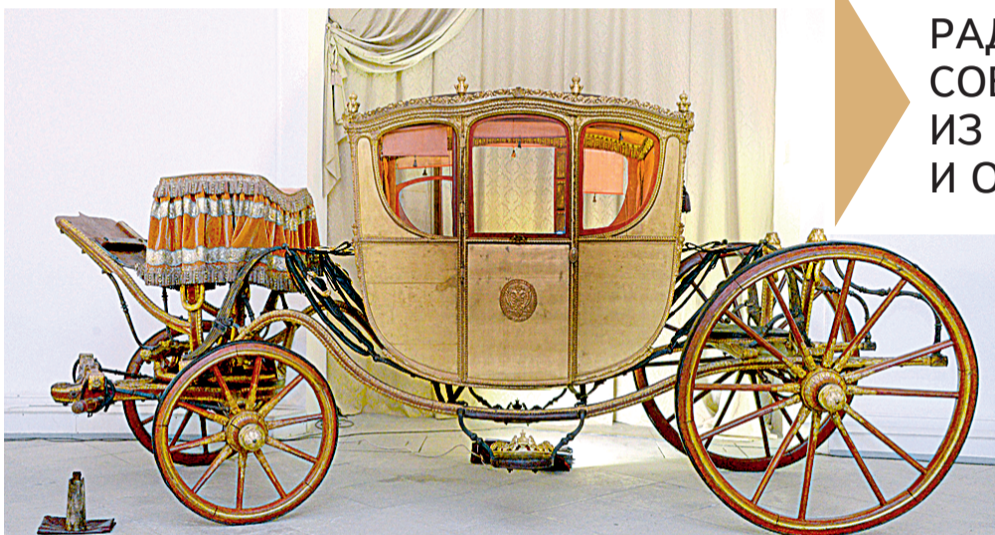
Красавица карета в центре внимания.

Правильно говорят, что новое — это хорошо забытое старое. К этой карете послышится подход как нельзя лучше. Хранилась она на задворках фонда карет — черная, пыльная, грязная, с выбитыми стеклами, утратившая многие внешние детали. И вспоминали о ней разве что при ревизии фонда. Да и по документам, поступившим вместе с каретой в 1928 году из расформированного Конюшенного музея в Ленинграде, — приобретена для императора Александра I в 1809 году. В общем, «парвеню», начало XIX столетия — не золотой век.