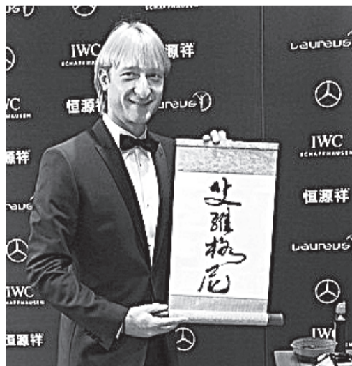
Евгений Плющенко узнал, как пишется его имя на китайском.