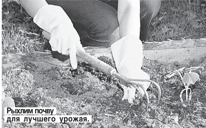
Рыхлим почву для лучшего урожая.

Благоприятное время для внесения компоста под многолетние цветочные культуры, плодовые деревья и ягодные кустарники.