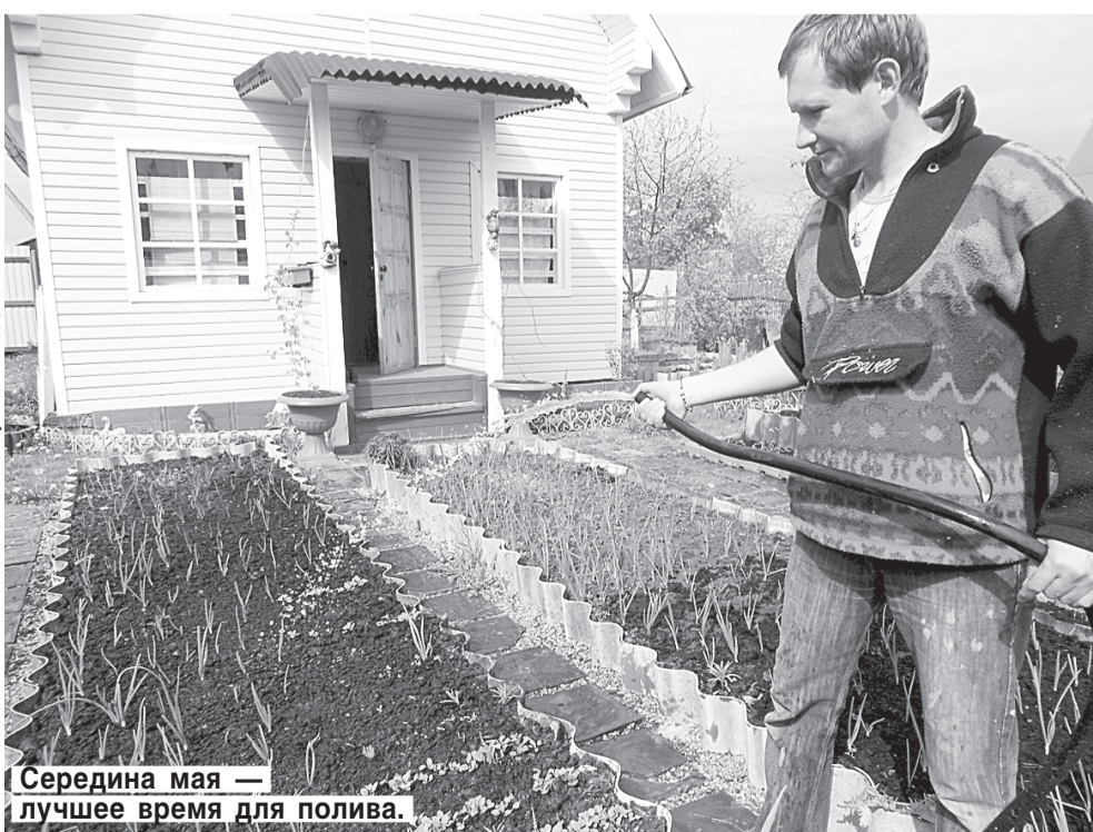
Середина мая — лучшее время для полива.

14 И 15 МАЯ Луна советует заняться вспашкой и рыхлением почвы, борьбой с вредителями и болезнями растений, прополкой и мульчированием, пасынкованием, удалением ненужной корневой поросли, проведением санитарной обрезки и удалением лишних, загущающих побегов. Хорошее время для поливов, корневых и внекорневых подкормок овощей и сбора ранней зелени, подкормки плодовых деревьев и ягодных кустарников. Луна решительно не советует что-либо сажать или сеять в эти дни.