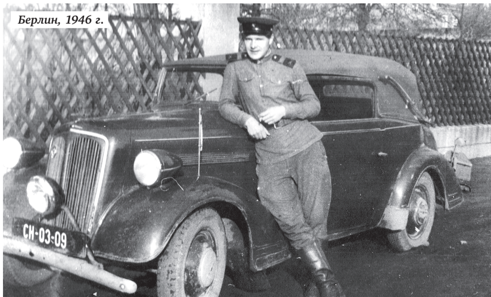
Берлин, 1946 г.

Беседовала Татьяна ВОРОНЦОВА