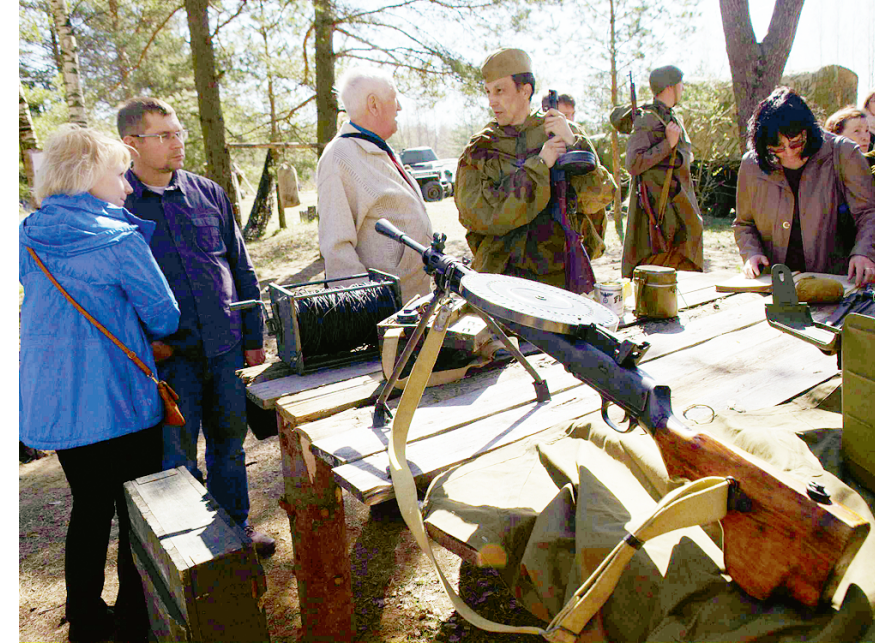
Посетители мемориала могут в эти дни «побить красноармейцами».