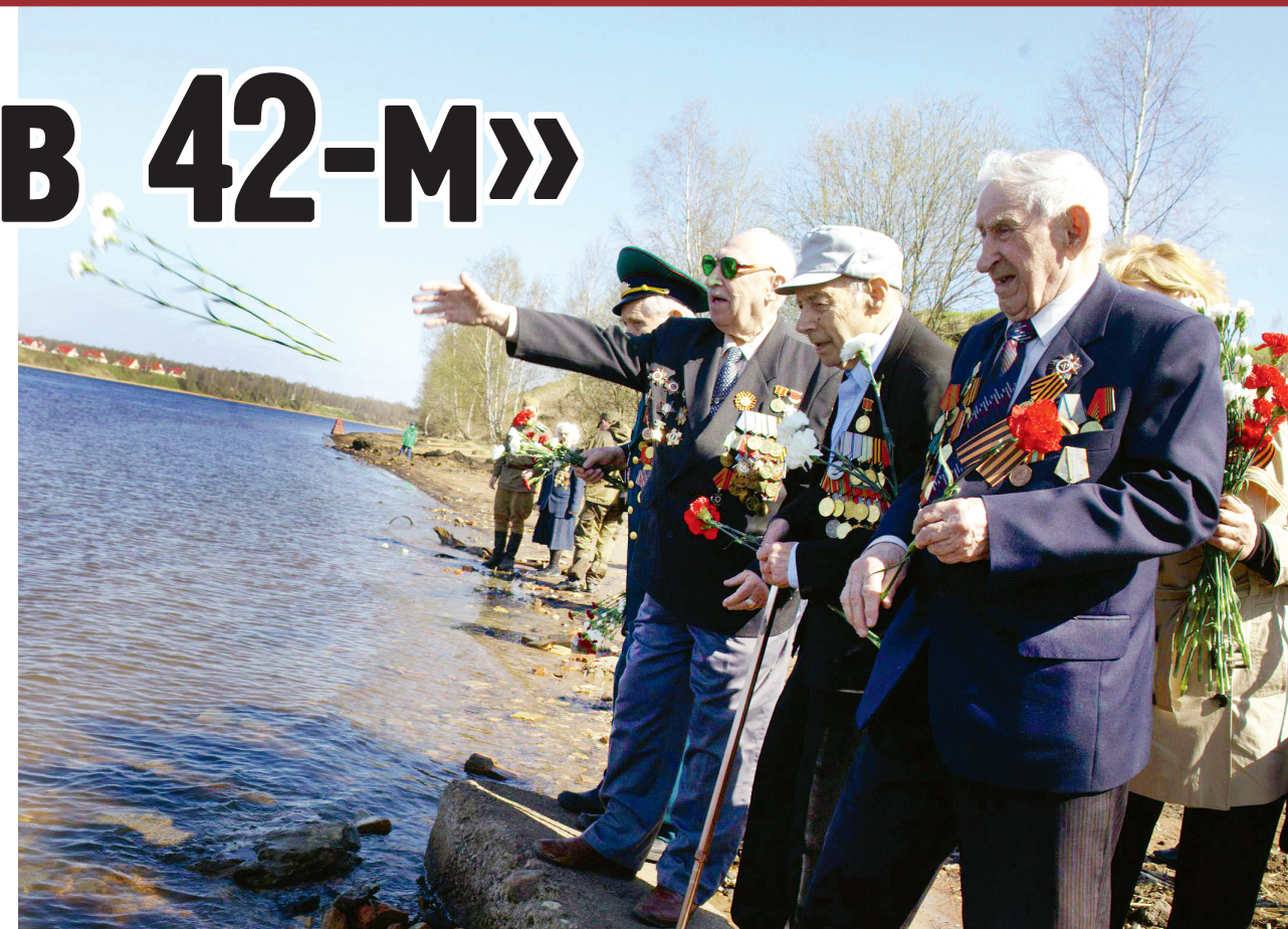
Цветы в воду — в память о погибших однополчаных.