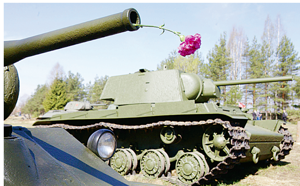
Мы помним, мы гордимся!