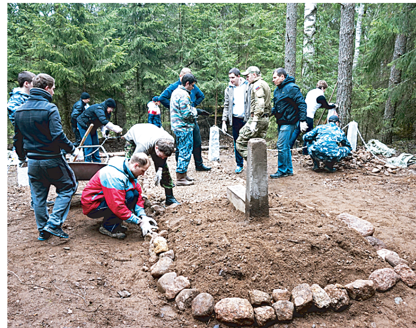
Восстанавливали мемориал буквально с нуля.

ШЕФСТВО над первой братской могилой советско-финляндской войны взяли сотрудники Правового управления ГУ МВД России по Петербургу и Ленинградской области. Захоронение расположено в районе местечка Таммисуо под Выборгом. Там в 1940 году были похоронены 87 бойцов Красной армии, а 22 июня 2014 года в рамках вахты памяти поисковиками были подзахоронены останки еще 49 воинов. Полицейские расчистили территорию и восстановили разрушенный памятник.