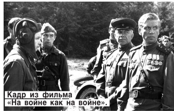
Кадр из фильма «На войне как на войне».