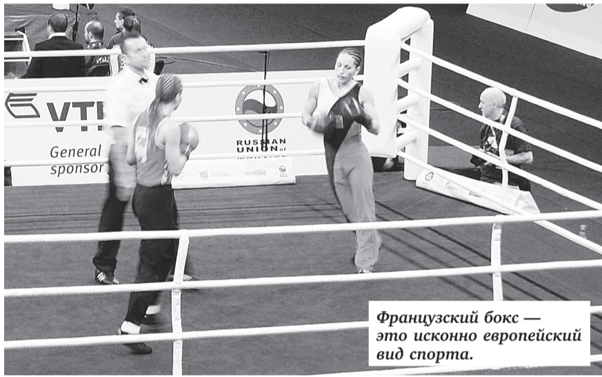
Французский бокс — это исконно европейский вид спорта.

Отметим, что техника французского бокса — савата напоминает восточные боевые единоборства, однако французский бокс — это исконно европейский вид спорта. Название происходит от французского слова «savate», или «старый ботинок». В данном виде спорта в отличие от английского бокса спортсмены во время боя наносят удары как руками, так и ногами, причем обутыми в жесткие ботинки.