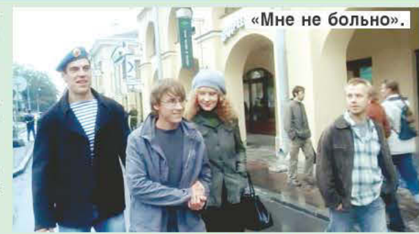
«Мне не больно».

Андрееvский торговый двор, Бугский переулок — фильмы «Брат», «Мне не больно». Место встречи Даниила Багрова и Немца. «Ну что, синяки, торгуем? По полтинничку теперь», — присаживается на корточки перед Немцем ракетир. «Но ведь я ничего не продал!» — «Товар конфискую!» Снимали на ступенях Андрееvского рынка (а не в Апрашке, как многие думают). Сейчас здание выглядит как новое. А вот в 90-е оно представляло собой удручающее зрелище: трещины, разломы, вывалившиеся кирпичи. У этого же рынка, только со стороны Волжского переулка, был снят эпизод с праздником ВДВ фильма «Мне не больно».