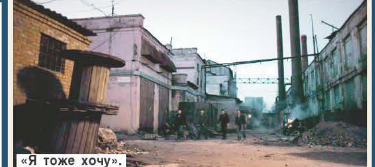
«Я тоже хочу».