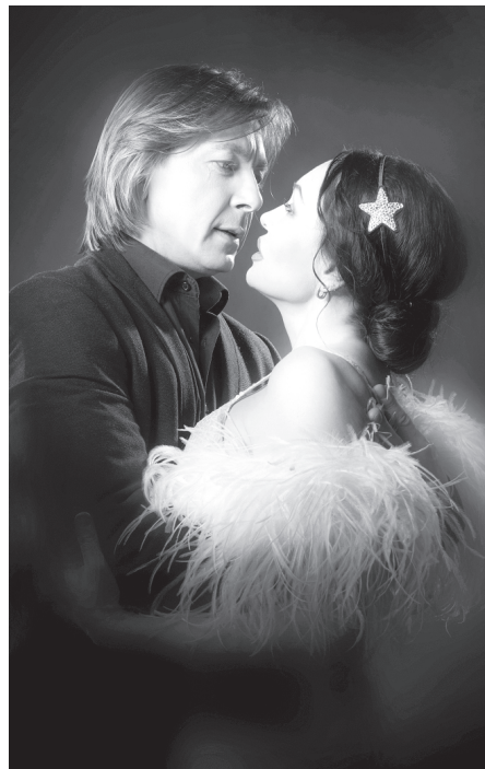
Сцена из мюзикла «Безымянная звезда».

21 мая и 19 июня на сцене ДК имени Горького покажут 3D-мэппинг-мюзикл «Безымянная звезда». Написанная в 1942 году пьеса румынского писателя и драматурга Михаила Себастьяна хорошо известна в России. Уже в 1956-м она была поставлена в БДТ, в 1957-м — во МХАТе. В 1978 году вышел по сей день любимый многими фильм Михаила Козакова.