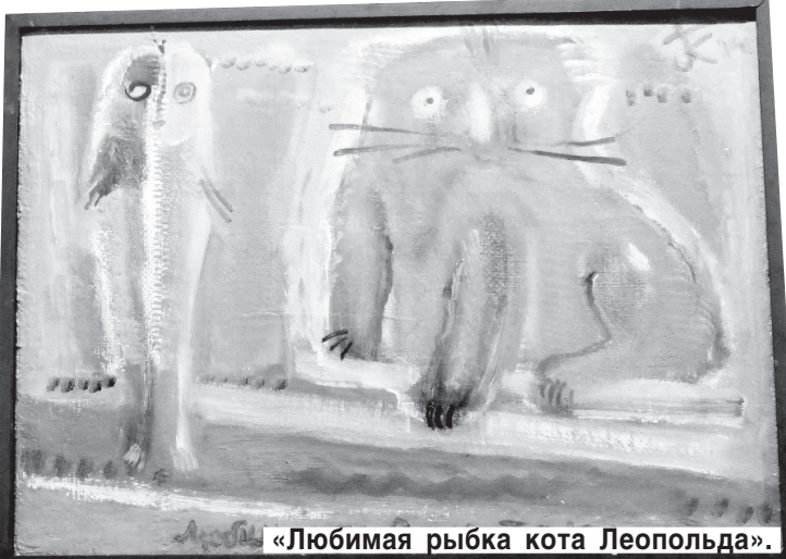
«Любимая рыбка кота Леопольда».