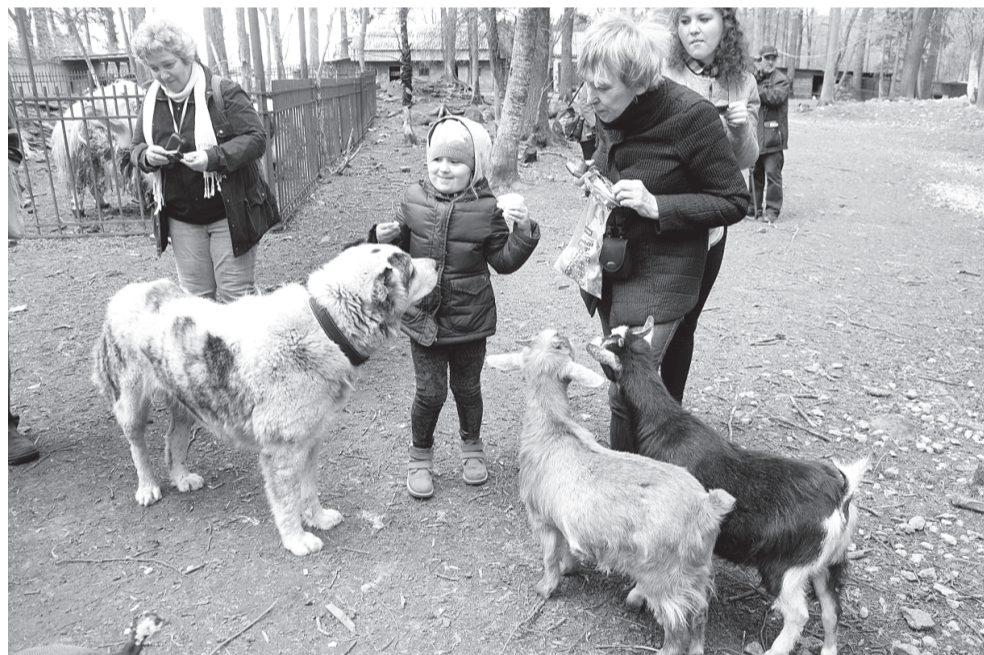
Здесь можно все: и кормить, и гладить животных, и фотографироваться с ними.

А еще в «Приюте Белоснежки» живет семья настоящих астраханских верблюдов, гусь по имени Киса Воробьянинов, еноты Чип и Дейл, сокол Сапсан, обезьяны, песцы, павлины, фазаны, черные лебеди, аист... Это далеко не полный перечень всех его обитателей. И в отличие от привычного