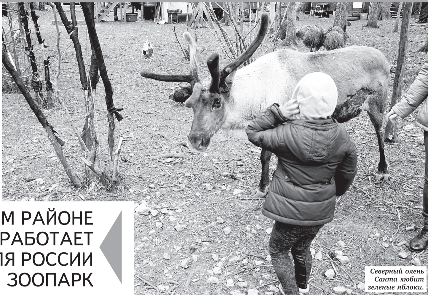
Северный олень Санта любит зеленые яблоки.

В том, что все это может происходить и у нас в Ленинградской области, можно убедиться самим, побывав в деревне Шадырицы, где на территории почти 2 га расположен контактный зоопарк «Приют Белоснежки». В минувшие выходные, когда мы отмечали Международный день семьи, здесь было особенно многолюдно.