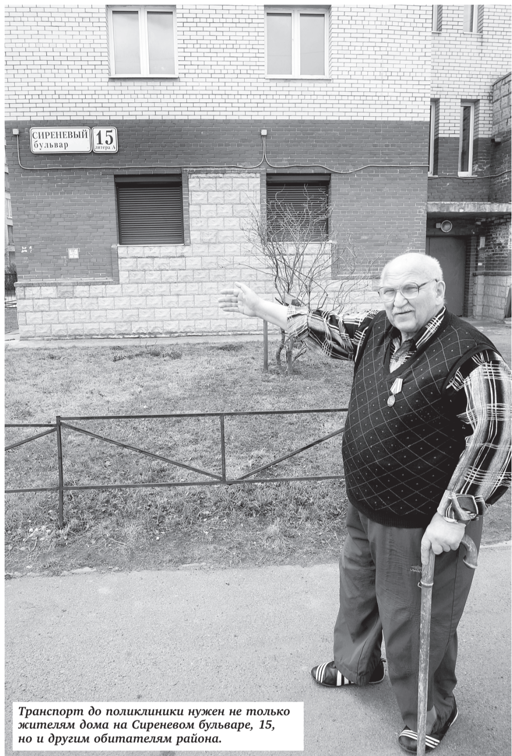
Транспорт до поликлиники нужен не только жителям дома на Сиреневом бульваре, 15, но и другим обитателям района.

Самое интересное, по словам Лозового, что городские власти признают наличие проблемы. И как будто готовы решать ее. Но только вот никак не получается. В комитете по транспорту заверяют: мы бы с радостью, но нужно согласование комитета по развитию транспортной инфраструктуры. В КРТИ, в свою очередь, отправляют в комитет по транспорту. Неразрешимая задача какая-то получается!